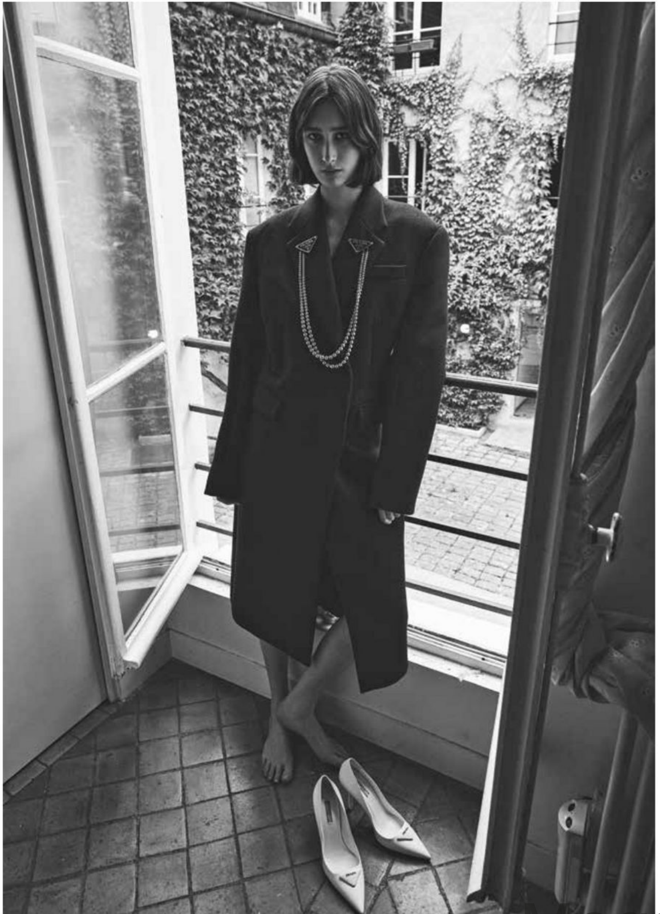
المعطف، القلادة، الحذاء، السعير عند الطلب، جميعها من Prada Coat; Necklace; Shoes, POA, all Prada