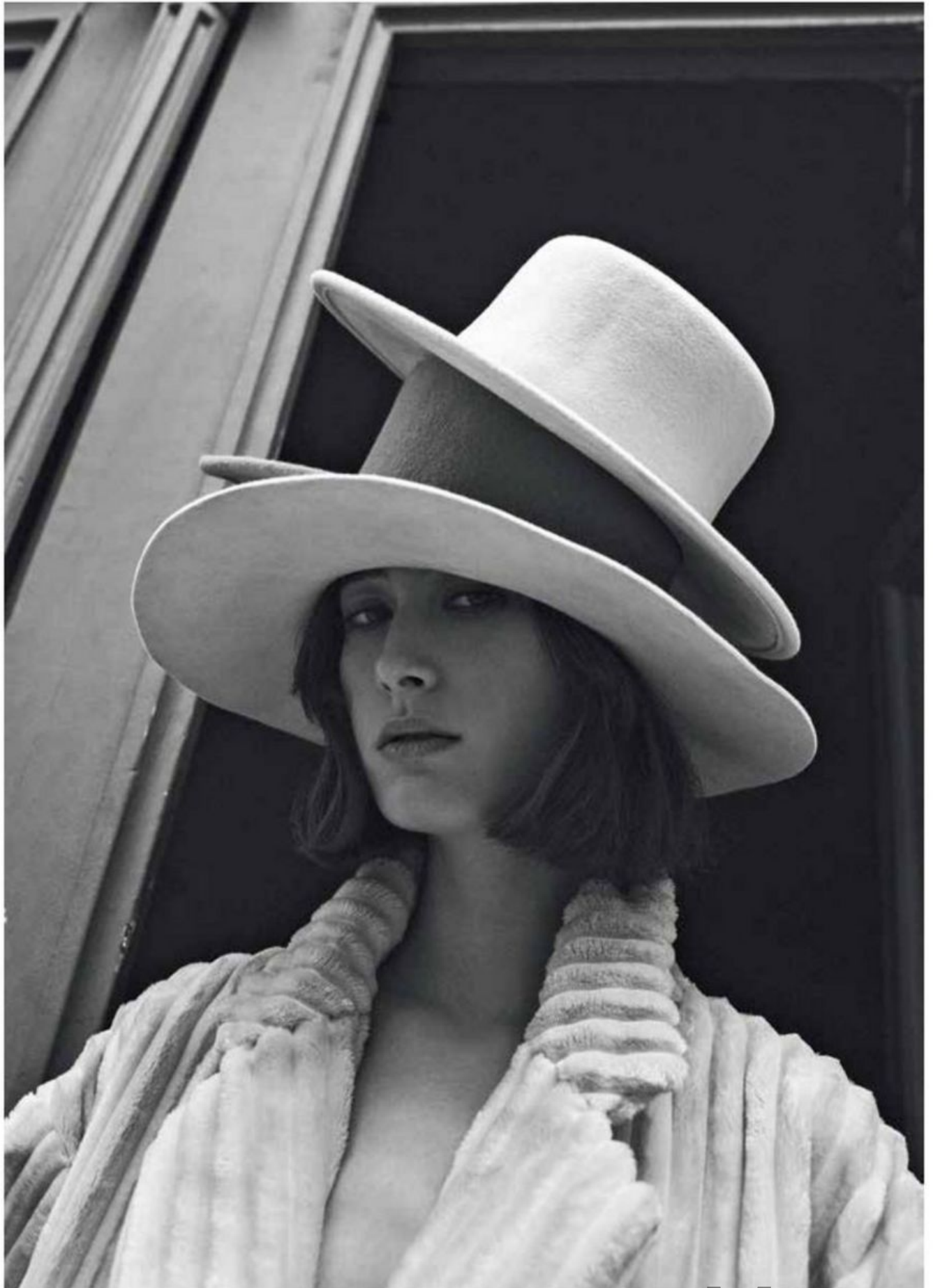
معطف، 3,060 ريال سعودي، القبعة الأولى، 1,150 ريال سعودي، القبعة الثانية، 450 ريال سعودي، القبعة الثالثة، 450 ريال سعودي، جميعها من Forte Forte Coat, SAR3,060; Bottom Hat, SAR1,150; Middle Hat, SAR450; Top Hat, SAR450, all Forte Forte